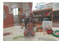
育児講座 センサリーボトル作り