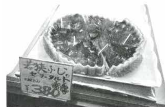
1期生が開発した「若狭ふじ(ぶどうブランド名)のゼリータルト

二〇二二年六月、近年の高浜近海の現状について、研究所のメンバーから話をしました。「美しく豊かな魚介類に恵まれているはずの藻場が今、大量のウニによって食べつくされようとしています。その藻場を守るためにボクたち漁師は去年は2万匹のウニを駆除しました。そんな駆除されてしまうムラサキウニの利活用方法をコドモの柔らかい頭で考えてほしい」 昨年の一学期生のプレゼンや商品が完成していく様子を見ていた新6年生たち。子どもたちは待ってました！とばかりの反応。入所願書を書き込み、コドモノ明日研究所2期生(6年生4人)が一学期生の思いを引き継ぎスタートしました。実物とウニの切身を確認した後、九つの班に分かれ、ウニの利活用案を考え始めました。