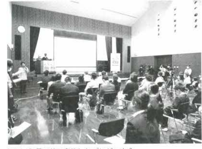
知事・町長の前で実施したプレゼン大会