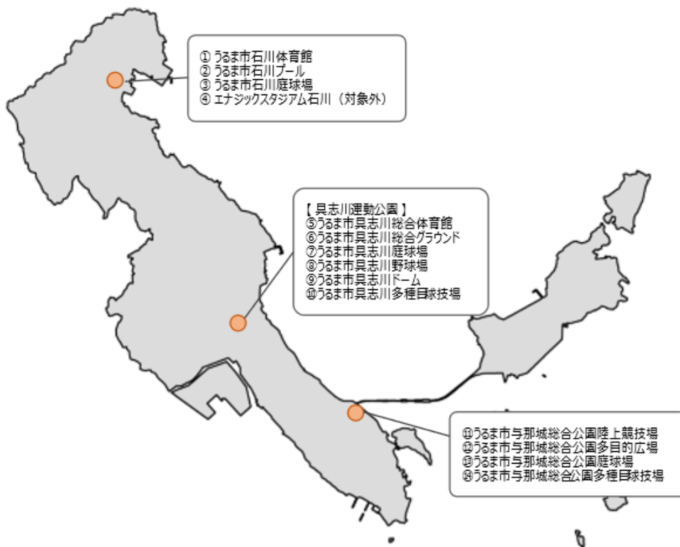
図. 体育施設及び運動公園位置図

市が所有する体育施設（うるま市立体育施設設置条例第2条に基づく）及び運動公園（うるま市都市公園条例施行規則第1条の2に基づく）を対象とします。ただし、ネーミングライツを既に導入している又は導入を予定している施設、及び愛称を付与することが適当でないと思われる施設については対象外とします。