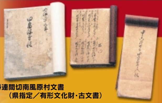
勝連間切南風原村文書(県指定/有形文化財・古文書)

サンゴ石灰岩を加工して作った素朴な獅子像です。村のフーチゲシ(邪気払い)として、南風原村が勝連城跡南側の元島原より移動した時(1726年)、村の境界として東西南北の4角に置かれたと伝えられています。 今では北側と西側が残っているだけですが、集落の研究や民俗資料として貴重なものです。