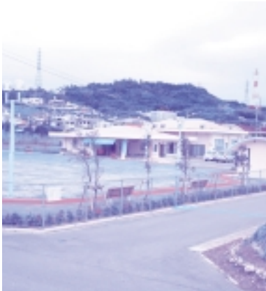
高江洲地区集落総合管理施設 (高江洲公民館)

【答弁】 経済部長 農地への被害が予想されるため、集落整備事業に組み込んで整備をしたい。