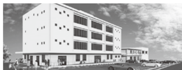
（仮称）うるま市こどもステーション 完成イメージ

医療棟には児童発達クリニック、脳神経外科と薬局が既に入居予定。その他の診療科目等は未定であるが、市としても小児科や内科の必要性は高いと考えている。地域住民の皆さんと共用した活用方法を近隣自治会と共同事業者と一緒に協議していく。