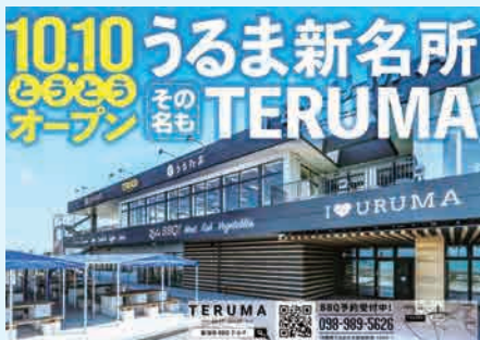
与那城照間にある東照間商業等施設は、名称を「TERUMA east coast」に改め、リニューアルオープンした

審議結果として、認定案件は認定し、議案は全て原案可決した。また、請願は継続審査。陳情は採択4件、不採択1件、継続審査7件となった。