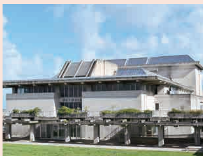
機能強化が図られる「きむたかホール」

審議結果として、認定案件は認定し、議案は全て原案可決した。また、陳情は趣旨採択2件、継続審査2件となった。