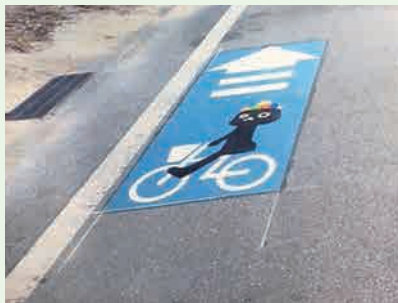
浜地区の自転車通行空間帯として、うるま市の自転車ピクトグラム整備を行った

審議結果として、認定案件は認定し、議案は全て原案可決した。陳情4件は継続審査となった。