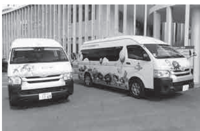
公共施設間連絡バスを活用し、コミュニティバス導入を見据えた実証実験を行っている

答 浜田都市建設部参事 公共施設以外の商業施設への新バス停の設置や、新たな地域への乗り入れを計画中で11月の実証運行開始を目指す。デマンド型交通は、区域を限定し利用者の予約により運行ルートが決まる乗合タクシーのようなもので、現在まだ協議中。実証開始時期も未定。