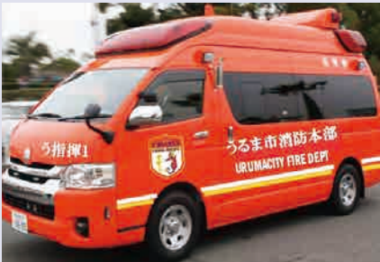
火災や災害現場で情報収集や安全管理などを効率的かつ円滑に行うため、指揮車と併せてドローンなども整備する

委員から「ドローンの整備について」質疑があり、当局から「ドローンのパイロット（操縦士）の資格は、講習会を受講することで取得できる。受講料は1人当たり約17万円である。今回整備するドローンの費用は、1機約44.5万円である」との答弁があった。審議結果として、認定案件は認定し、議案は全て原案可決した。陳情1件は継続審査となった。