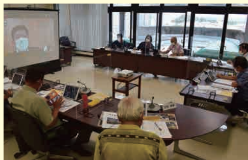
タブレット端末を活用したオンライン視察の様子

概要：議会だよりの「読みやすさ」「親しみやすさ」を追求するため、紙面リニューアルや市民参画などの取組を行い町村議会広報全国コンクール4年連続1位受賞の埼玉県寄居町議会へ「議会広報紙」の編集・発行について、本市議会初となるオンライン視察を行いました。