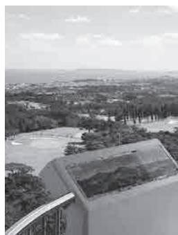
石川高原展望台からの絶景

答 早めに補修したいと考えているが、状況を勘案しながら対応することになる。また、高木剪定には、期間を要する場合もあるため、利用者には不便をかけるが、御理解いただきたい。