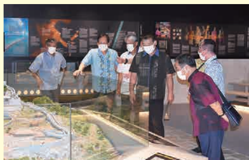
市当局から説明を受けながら、各施設を視察した

概要：あまわりパーク歴史文化施設の建設状況や今後の運営等について調査した。調査では、施設の視察とあわせて、担当職員から説明を受けるとともに、活発な意見が交わされました。