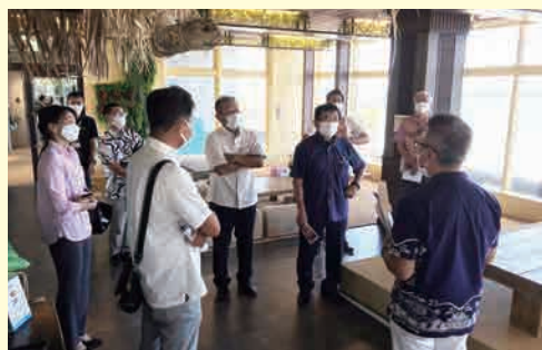
入居企業から、各ブースの詳しい説明を受けた

概要：市内の産業振興、雇用創出、地域活性化等の諸施策に役立てるため、東照間商業等施設の現状を確認した。調査では、施設の視察とあわせて、担当職員や入居企業から説明を受けるとともに、委員から活発な質問がありました。