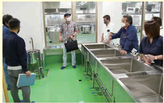
施設職員から詳細な説明を受けながら見学し、活発な意見交換が行われた