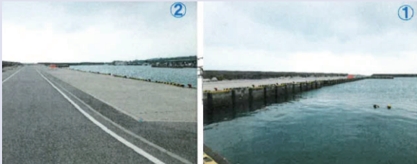
当該箇所は、モズク養殖漁業用網の補修や干場用地、網等を運搬するためアクセス道路及び道路を保護するため、公有水面埋立法に基づき護岸整備された