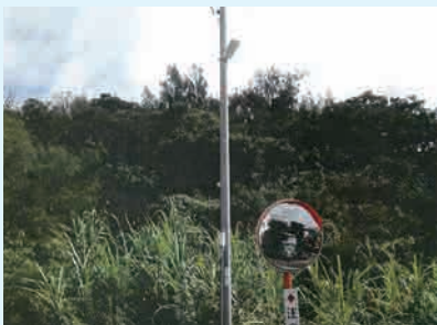
夜間における市民の安全及び犯罪被害の未然防止を図るために設置された防犯灯

審査結果として、議案は全て原案可決した。また、請願は採択1件、継続審査1件。陳情は採択2件、継続審査4件となった。