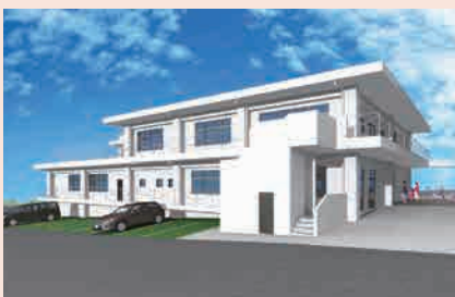
復帰記念会館跡地に、令和4年8月完成予定の「うるま市児童福祉関連複合施設」完成予想図

審査結果として、承認案件は承認し、議案は全て原案可決した。また、陳情は不採択1件、継続審査2件となった。