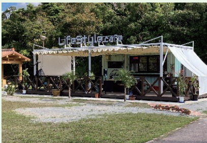
令和3年11月、石川運動広場内にオープンした官民連携によるカフェ「ライフスタイルカフェ」

審査結果として、議案は全て原案可決し、請願1件は趣旨採択、陳情4件は継続審査となった。