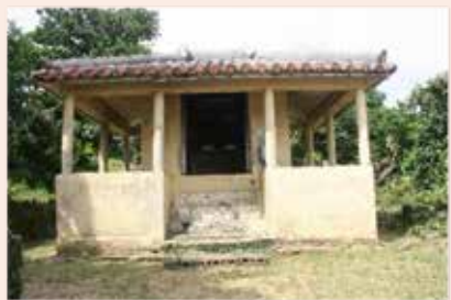
老朽化した石川嘉手苺にある嘉手苺観音堂

主な審査内容として『令和4年度一般会計補正予算（第2号）』について、委員から「文化財保護及び管理費の設計業務委託料の内容について」質疑があり、当局から「石川嘉手苺にある市指定文化財、嘉手苺観音堂が老朽化のため危険な状態となっており、その現状調査と修繕方法を検討するための設計業務委託料となっている」との答弁があった。 審査結果として、承認案件は承認し、議案は全て原案可決した。また、請願は一部採択、陳情3件は継続審査となった。