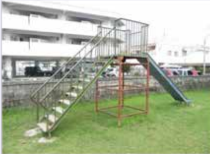
げんき公園の遊具の現状

主な審査内容として『令和4年度一般会計補正予算（第2号）』について、委員から「歳入の石油貯蔵施設立地対策等交付金（石油備蓄）150万円円の補正増の内容について」質疑があり、当局から「都市公園遊戯施設更新事業に係る補正増となっている。具体的には、中部病院横にあるげんき公園の遊具改修事業となっており、当初は500万円での予算を計上していたが、実際の設計内容を整理した結果、予算の増額が必要となったため、補正予算を計上している」との答弁があった。 審査結果として、議案は全て原案可決し、請願1件は不採択、陳情は1件が趣旨採択、2件は継続審査となった。