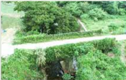
橋梁建て替えが進む川崎ルーシー河線道路

主な審査内容として『令和4年度一般会計補正予算（第2号）』について、委員から「川崎ルーシー河線道路改良事業における進捗状況と増額理由について」質疑があり、当局から「令和2年度決算時において事業進捗率57・6%である。また、増額理由としては、令和4年度と5年度にまたがる橋梁建て替え工事にかかる部分において、中間前払い金の不足分を補うための増額となっている。令和5年度の前期倒しであるため工事費全体としては変わらない」との答弁があった。 審査結果として、議案は全て原案可決し、請願1件は一部採択、陳情5件は継続審査となった。