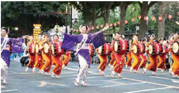
盛岡市で行われたさんさ踊り

採決の結果 ※退席あり 委員会＝原案可決(全会一致) 本会議＝原案可決(賛成多数)