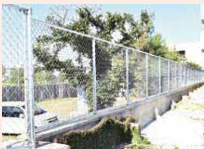
教育環境改善のため取換えられた 与那城小の外壁フェンス

主な審査内容として『令和4年度うるま市一般会計補正予算（第7号）』について、委員から「小・中学校施設修繕費について」の質疑があり、当局から「小学校は、主に伊波小学校の図書室の空調機修繕や南原小学校の空調機修繕、与那城小学校のフェンスの取換え修繕、中学校は、主に高江洲中学校や与勝中学校の理科教室の空調機修繕、あげな中学校の特別教室の空調機修繕、与勝第二中学校の消防設備の修繕を見込んでおり、年度内で完了する」との答弁があった。