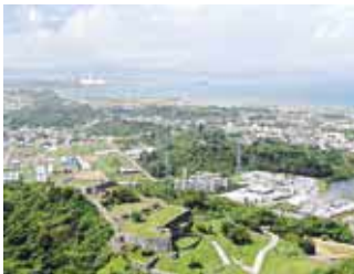
土地の取得が進む勝連城跡周辺

〔答〕 土地単価は登記地目ではなく、現在の利用状況で評価し決定している。土地評価業務を不動産鑑定士等に依頼し、近隣地域等の同種の取引事例を比較参照して単価を決定している。