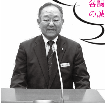
ひがなおと 議長 比嘉直人

『一般質問』は、議員が市の行政全般にわたり、執行機関に対し事務の執行状況及び将来に対する方針等について所信をただし、あるいは報告、説明を求め、又は疑問をただすことをいいます。