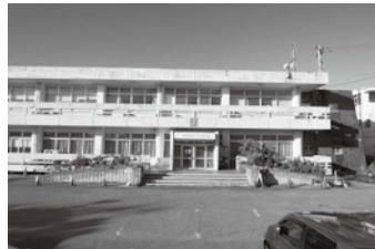
周辺公共施設へ機能移転され、解体が予定される与那城地区公民館