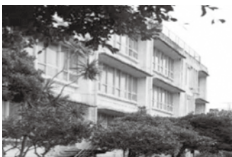
教室不足などで整備が望まれるあげな小

金城こども未来部長 あげな子ども園は、本園と旧あげな保育所を分園として運営しており、今後の整備については、両施設を含め安全性や保育環境、保護者の利便性等を踏まえ検討したい。