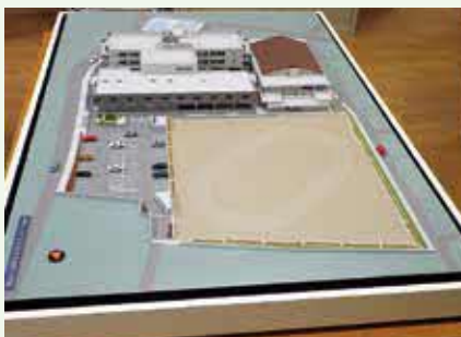
老朽化に伴う工事、城前小。 完成するとこうなります！

主な審査内容として『城前小学校屋内運動場増築工事（建築）請負契約についての議決内容の一部変更について』等4件の一括議題について、委員から「工事追加になった理由は」との質疑があり、当局から「事前程度支持地盤の長さを計測するが、既設の校舎があった場合はその周辺でしかボーリングができない。実際取り壊した後でないと正確な計測ができないため追加となった」との答弁があった。