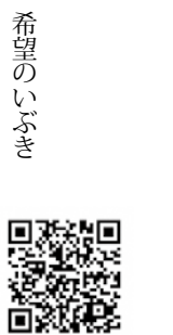
録画映像があります

宇江城学校教育部長 今年度は、コロナの感染状況に鑑みつつ、各学校とも卒業生、保護者が思い出に残る卒業式を工夫して