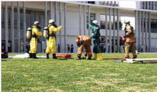
特殊災害対応資器材を用いた実働訓練 市民の生命・財産を守るため、あらゆる事態に備えた訓練は欠かせない

主な審査内容として『令和4年度うるま市一般会計補正予算（第7号）』について、委員から「特殊災害対応資器材購入事業において、どのような資器材を購入する予定か」との質疑があり、当局から「化学防護服8着、手袋8双、空気呼吸器8器、空気ボンベ16本の購入を予定している」との答弁があった。審査結果として、議案は全て原案可決した。また、陳情2件は趣旨採択となった。