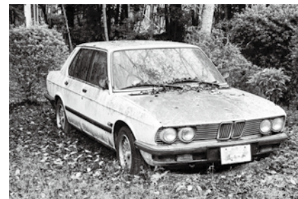
放置された車両 (イメージ)

を締結すると放置車両が早期に撤去でき、費用も原則無料、メリットは多くあるが、今後の取組を伺う。