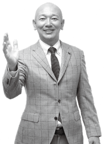
かけはし こうき 幸喜 勇 いさむ

質 モルタル片の落下は、建物躯体部分のコンクリートには、剝離やひび割れ等の大きな影響が見られないので構造上、危険な状態にある建物とはならない。今後も修繕等に対応しながら引き続き老朽化具合を注視するとともに、再度の耐力度調査の時期の検討や、県の担当課へ現状を説明していく。