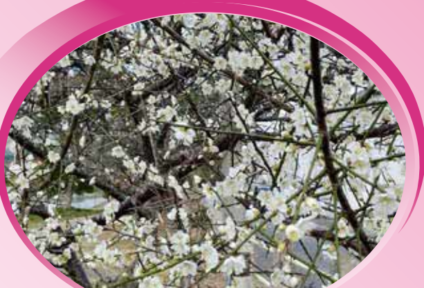
遊歩道を彩る梅の花 (石川川沿い)

うるま市議会の詳しい情報は、こちら 👉 ホームページ https://www.city.uruma.lg.jp/shisei/162