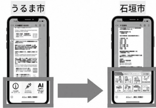
役場に行かなくてもLINEで完結？

メニューを拡充し行政手続きがオンラインで行えるようお願いしたいが。中里企画部参事 システム構築のため業務委託契約を締結した。その中でリッチメニューについても拡充していく。また、オンライン申請が可能な業務については、その構築に向け関係各課と調整を進めている。