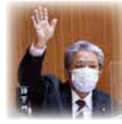
下門 勝 議員

津堅島訓練場水域におけるパラシュート降下訓練に対し、嚴重に抗議するとともに、同訓練の中止等を強く要求するため。