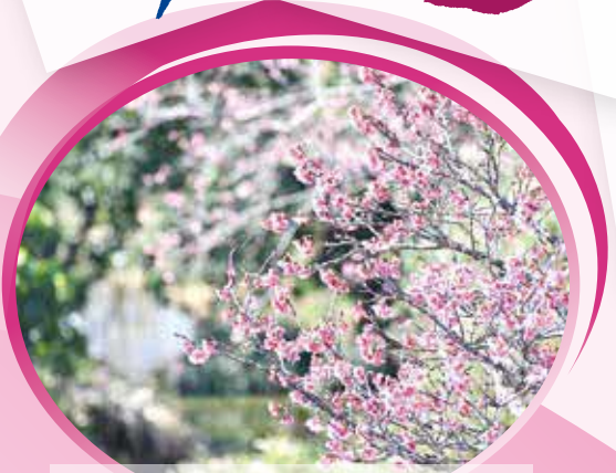
春の訪れを告げる桜 (ヌーリ川沿い)