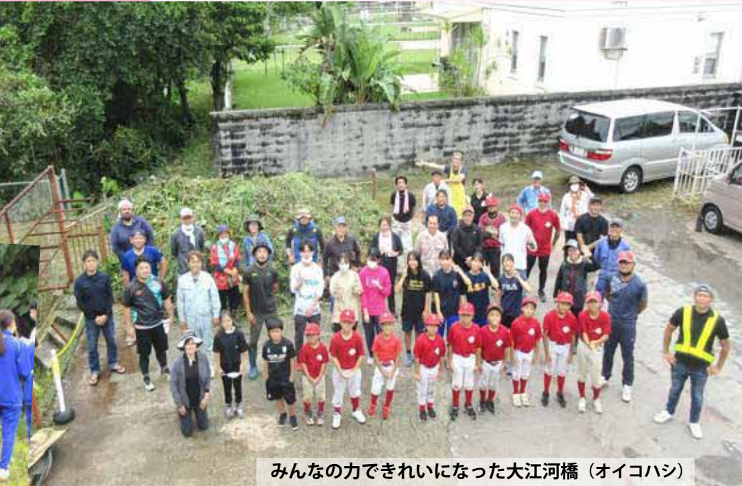
みんなの力できれいになった大江河橋 (オイコハシ)