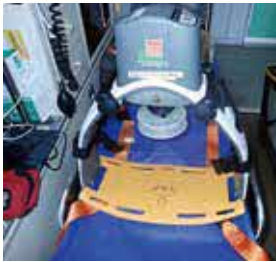
市民の命を守るための機器更新

〔答〕 当事業の内容については、現在本市が保有している救急自動車積載の当該機器3台を更新整備する事業で、配備先については、石川消防署、与勝消防署、平安座出張所となっている。