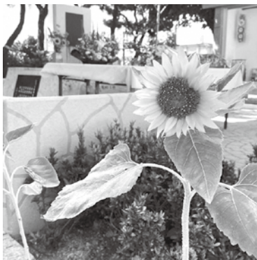
宮森小には、2度と悲惨な事故が起こらないように、仲よし地蔵が設置されています

質 うるま市でもPFASが検出され、不安に思っている市民の方々がいる。市長はどのように考え向き合っていくのか伺う。