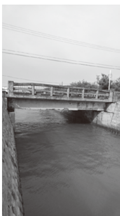
通行止めとなった2号橋

答 浜田都市建設部参事 今年度から、架けかえ工事に着手する予定であり、令和3年度中の開通に向け、取り組んでいきたい。