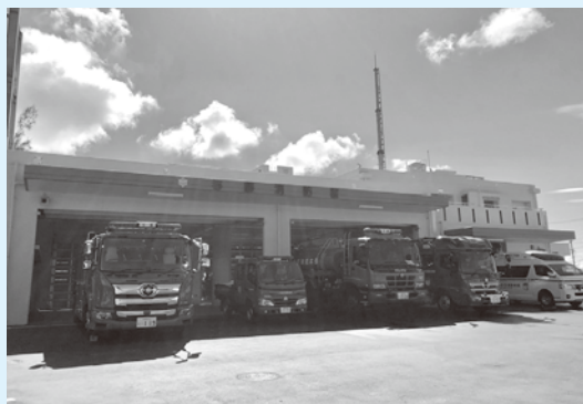
与勝消防署新庁舎に係る予算についても審査