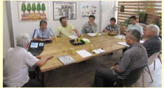
ものづくり(製造業)の状況や取り組みについて説明を受ける委員

【概 要】 本市にある、ものづくり企業の取り組みについて視察を行った。視察では、実際に製造されたEV自動車や、人材育成への取り組み、今後の展望などについて説明を受け、活発な意見交換がなされました。