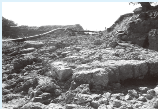
これから復元修理を行う西原御門の石畳道