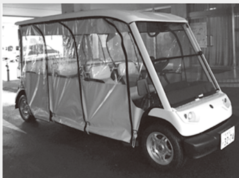
うるま市で製造されているEV自動車