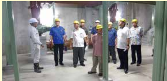
施設の機器整備の際に使用する地下通路なども調査した(石川終末処理場)

【概 要】 石川終末処理場・具志川浄化センターの下水処理の現状について、所管事務調査を行いました。調査では、委員から下水処理を行う施設の概要などについて活発な質疑がありました。