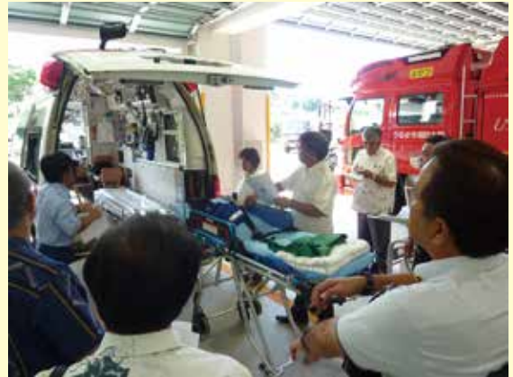
救急自動車内部や装備資機材を確認した。

【調査日】 令和元年9月24日(火)午後2時 【場 所】 与勝消防署 【概 要】 与勝消防署に配備されている消防自動車及び救急自動車について調査しました。調査では、担当職員から救命資機材、消防自動車及び救急自動車の説明を受け、その内容を確認しました。