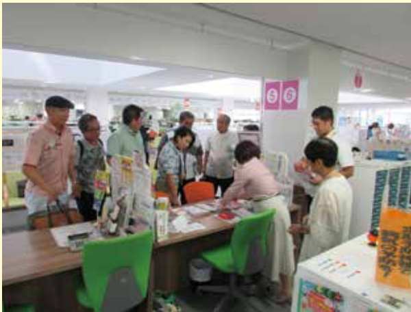
妊娠届出時間診票の手続きの流れなどを確認した。

【調査日】 令和元年9月24日(火)午後1時 【場 所】 うるま市役所東棟2階 (こども健康課内5番窓口) 【概 要】 うるま市子育て世代包括支援センター“だいすき”に係る調査を行いました。調査では、貧困や虐待などもあり、予防に取り組んでいる。また、経済的支援だけではなく、育児支援者がいない方への支援などを確認しました。