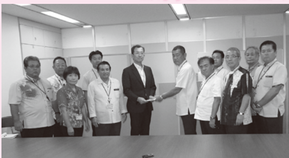
地方協力局長に要請書を手交し、市の実情を訴えた。