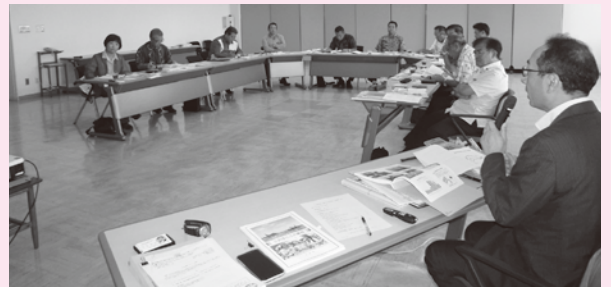
三沢市職員から現状と対応等について説明を受けた。

調査では、担当職員から概要説明を受けた後、市民の安全・安心を守る視点で、活発な意見が交わされました。