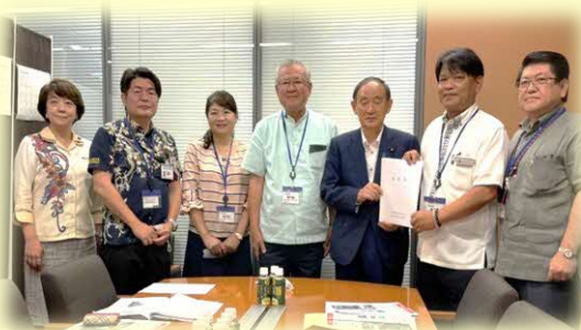
行政機関へのの要請活動