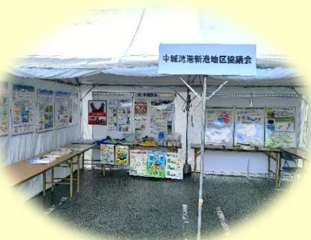
うるま市産業まつり等への 出展支援