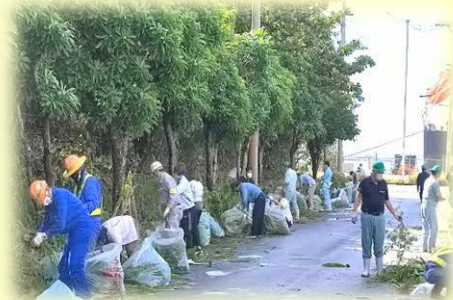
地区内クリーン活動