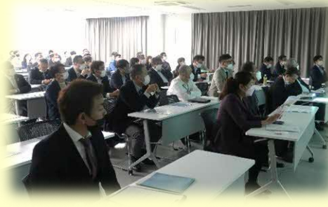
企業支援セミナー