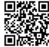
スマートフォン用 QR コード

スマホ https://gis.city.uruma.lg.jp/uruma-sp/