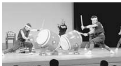
▲具志川かつしん太鼓の勇壮な太鼓演舞