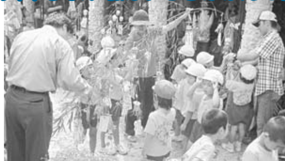
▲願い事を書いた短冊を笹につける園児たち