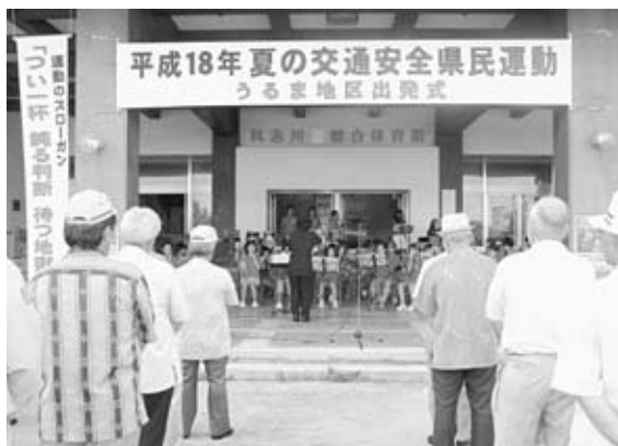
▲夏の交通安全出発式を盛り上げた田場小金管バンドの演奏

7月10日から19日の10日間「つい一杯 鈍る判断 待つ地獄」をスローガンに夏の交通安全県民運動うるま地区出発式が多くの関係者が集い、市総合体育館前で行われました。