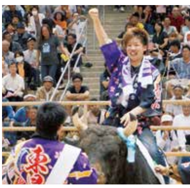
【勝利のガッツポーズ】

また、5月8日、10日の3日間、闘牛写真展が石川舞天館で併せて開催され、過去の取り組みの写真や動画のほか、オリジナルの闘牛タオル等が展示され、多くの来場者で賑わいました。