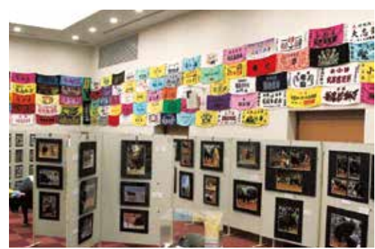
【闘牛写真展の様子】

翌日の5月10日には、闘牛文化を有する全国6県から、「闘牛」を開催している9市町の関係者が一堂に集い、「第18回国闘牛サミット協議会」が、うるま市石川保険相談センターで開催されました。