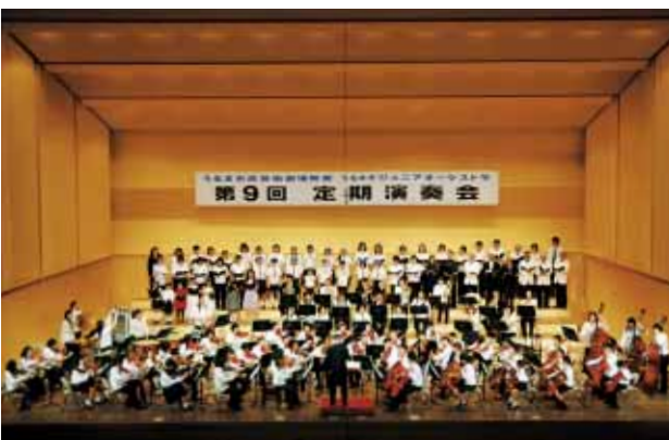
去年開催された第9回定期演奏会の様子