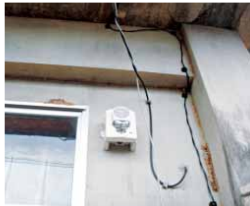
屋外の警報装置(ホーンストロボ)設置状況

うるま市消防本部では、住宅用火災警報器の普及啓発を行っていることから、住宅防火対策推進協議会(財)日本防火・危機管理推進協会が実施しているモデル事業への申請を行ったところ、津堅地区が選定されました。今回のモデル事業は、火災発生時に避難などの対応が困難となり易い高齢者や障害者を対象として、屋内に住宅用火災警報器を設置し、連動して屋外へ電子ブザーとストロボによって付近住民へ報知し、高齢者等の避難を補助