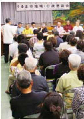
5月22日に開催された平安座、浜、 比嘉自治会の懇談会