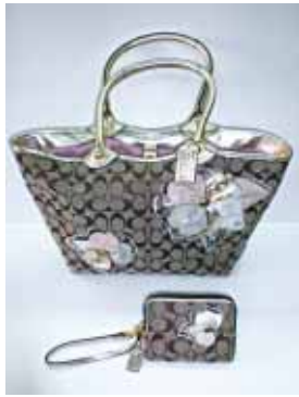
写真はほんの一例です。ほかに多数あります。