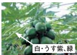
「台農5号」ではありません。