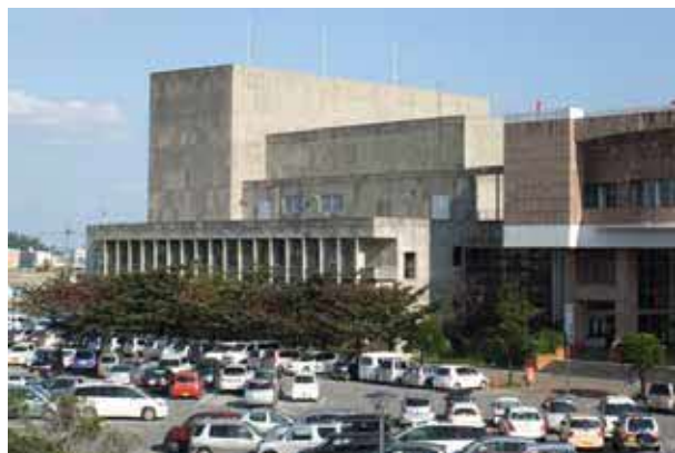
Uruma Ishikawa Hall