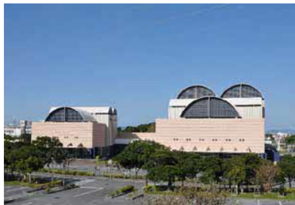
Uruma Citizen Art Theater