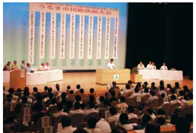
多くの関係団体が参加して行われた大会の様子

夏休みを目前に控え、青少年の深夜はいかいなどを防ぐ目的に7月15日、「青少年の深夜はいかい防止」、「未成年者飲酒防止」県民一斉行動うるま市民総決起大会が、きむたかホールで行われました。大会では、中学、高校、保護者の各代表による意見発表のあと、「非行の芽生えを許さない『愛の一声運動』を展開しよう」などの大会宣言が読み上げられました。