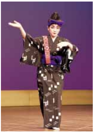
東照子琉舞道場による加那ヨー