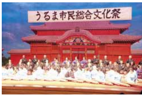
幕開けの古典音楽斉唱

7月16日、17日の2日間、「うちそろて高めらな、うるま市の文化」をテーマに文化祭が市民芸術劇場で開催されました。かぎやで風で幕が開け、琉舞や大正琴など文化協会の会員による舞台発表が行われました。会員各部の熱演に、詰めかけた観客から、大きな声援が聞かれていました。