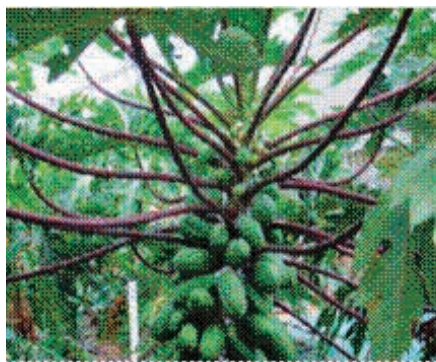
【未承認の遺伝子組換えと思われるパパイヤ】

なお、葉柄が赤くても「EXP15」、「甘泉」、「プレミアム」、「豊作」等の品種が分かっているものであれば、遺伝子組み換え体ではないことから、検査の必要はありません。国では、未承認の遺伝子組換えパパイヤかどうかについて、7月以降、要望に応じて無料で検査することを予定しています。「葉柄の赤いパパイヤ」がご自宅の庭などで生育してしまったり、左記の連絡先までご相談下さい。 なお、当該パパイヤの食品としての安全性については、厚生労働省が食べることによる体への影響は確認されていないとの見解が示されています。