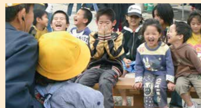
あげなフェスタ(2007年2月)