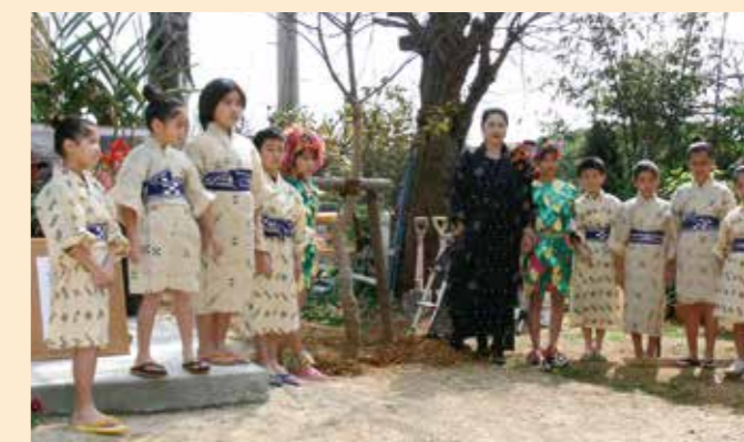
文化の発信地ていーだぬやがま家開所式(2007年2月)