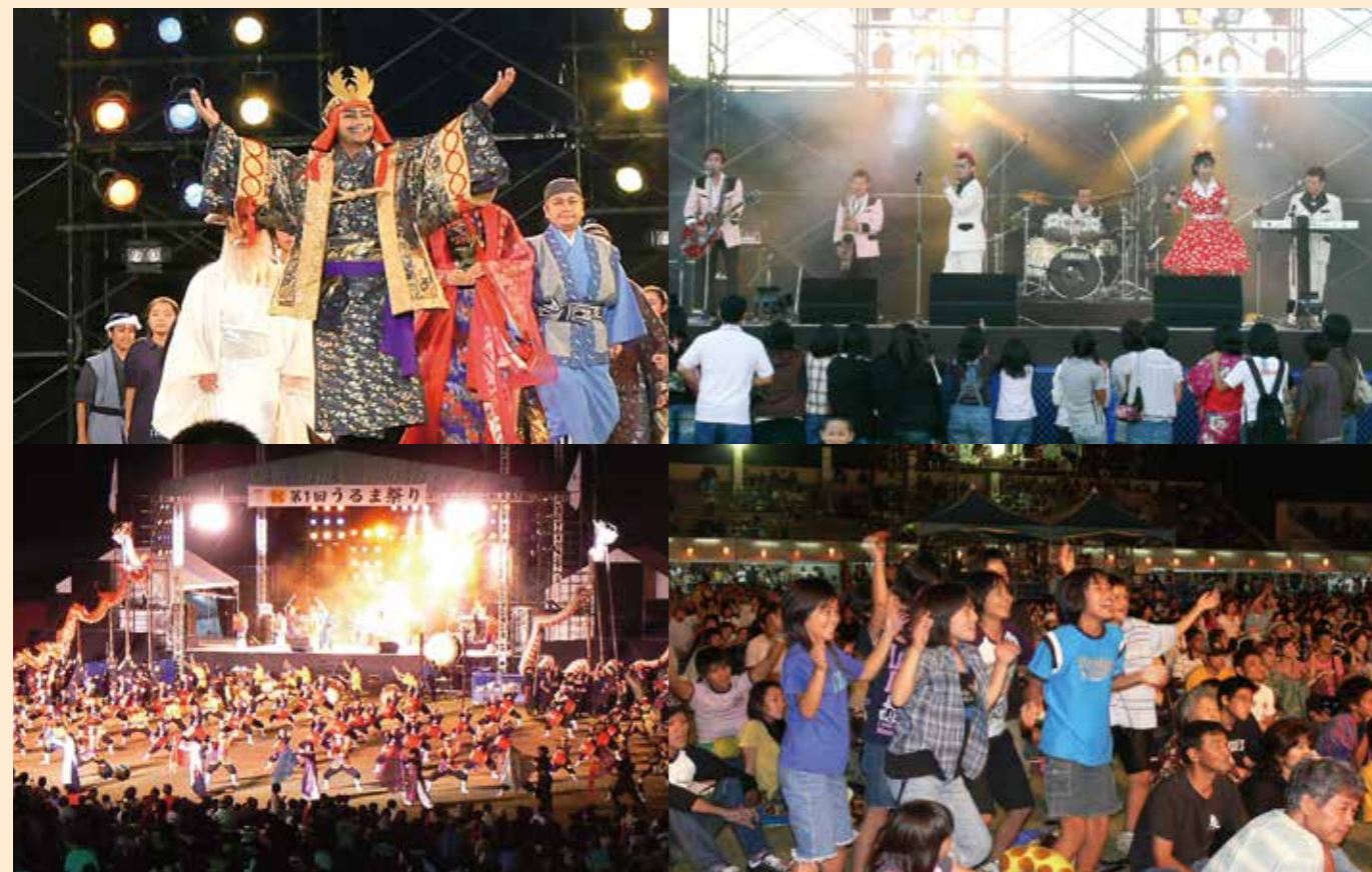
第1回うるま祭り開催(2006年10月)

「第1回うるま市エイサーまつり」(8月)には、野の花保育園・大地学童クラブの保育園児、勝連地域の子ども会2団体と市内の青年会14団体が出場し、子どもたちも大人顔負けの演舞を披露しました。「第1回うるま祭り」(10月)は初日の盆栽展を皮切りに闘牛大会、ヤングミュージックステージ、うるま市民謡の夕べ、龍神の宴～新たなる伝説～など、多彩な催しで多くの人々で賑わいました。