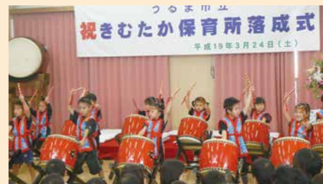
市立きむたか保育所落成式(2007年3月)