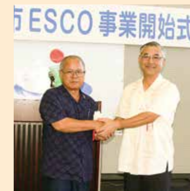
公共施設県内初のESCO事業を開始(2006年8月)