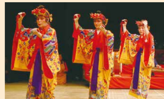
第1回うるま市伝統芸能祭(2007年1月)