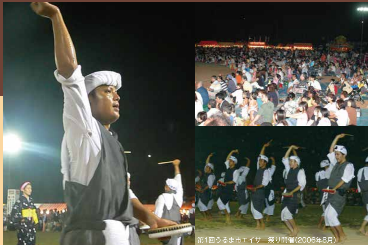
第1回うるま市エイサー祭り開催(2006年8月)