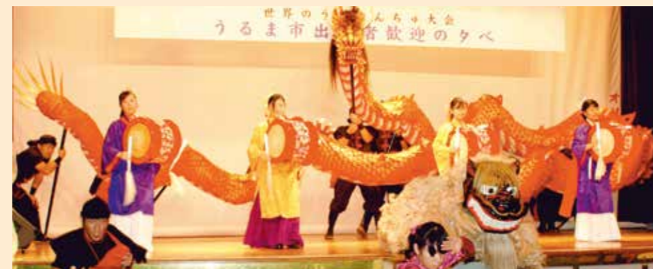
世界のウチナーンチュ大会うるま市出身者歓迎の夕べ(2006年10月)