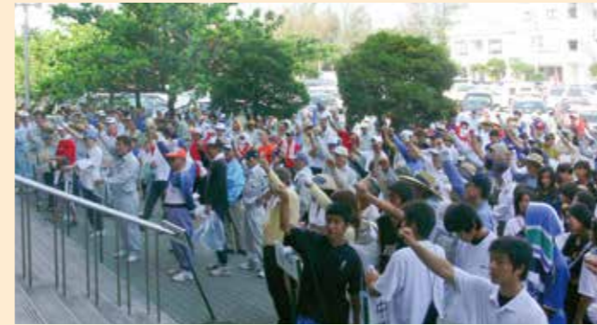
「ALL OKINAWAグリーンアップキャンペーン2007」(2007年8月)

うるま市が誕生して3年目となる平成20年1月9日、「うるま市合併記念式典」が市民芸術劇場で開催されました。式典では市町村合併功労者として旧4市町の首長・議会議長へ総務大臣表彰が行われたほか、合併功労者として個人98人と1団体に市長から感謝状が贈られました。