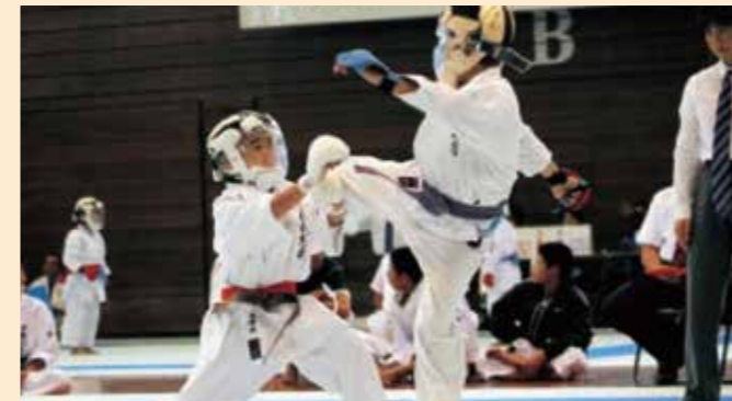
第1回うるま市若獅子空手交流大会(2007年12月)