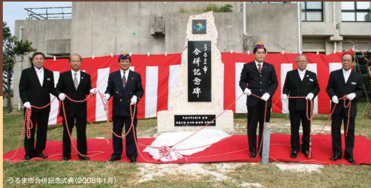
うるま市合併記念式典(2008年1月)