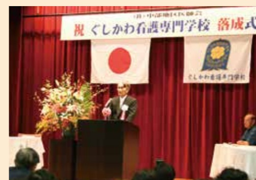
ぐしかわ看護専門学校校舎落成式(2008年3月)