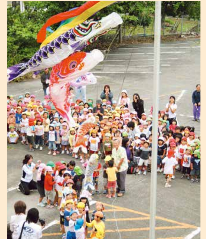
こいのぼり掲揚式(2007年5月)