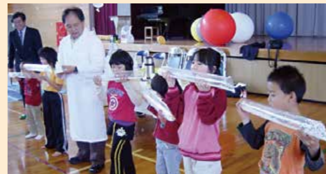
サイエンスフォーラムinうるま&チムドンドン出前科学実験in津堅島(2008年2月)

市の伝統的な催しや地域及び文化等の交流の場となる「石川多目的ドーム」(収容人数約3,000人)が5月12日に落成。多くの関係者が参加して施設の完成を祝いました。