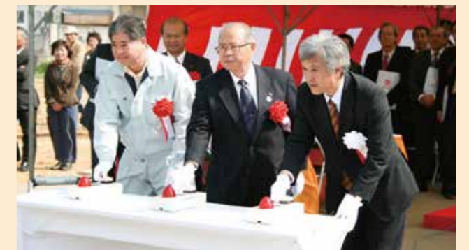
県営かんがい排水事業と勝地下ダム完成式典(2008年3月)