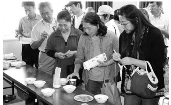
新商品を試食する参加者