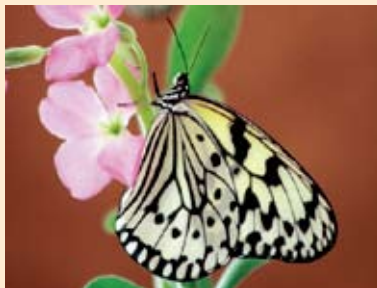
うるま市の蝶 オオゴマダラ 平成18年12月18日制定