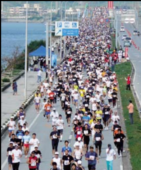
海風を受けて、爽快に海中道路を駆けるランナー