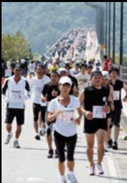
ハーフマラソンの最難関▶ 浜比嘉大橋