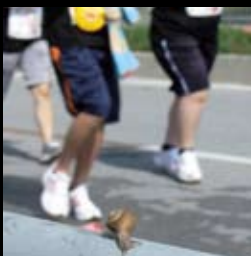
カタツムリもエントリー？