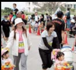
多くの親子連れが参加した 3.8kmトリムマラソン