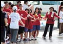
ボランティアや沿道の声援を力に・・・