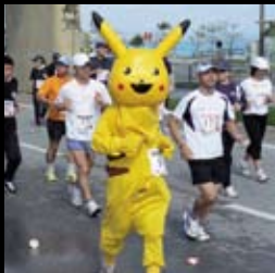
日差しが照りつける中、ピカチュウも頑張りました。

ハーフマラソンと10km、3.8kmのトリムマラソンに、6330人が参加。 海に囲まれた風光明媚なうるまの自然を楽しみながら、爽快な汗を流しました。