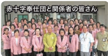
赤十字奉仕団と関係者の皆さん

天願川清流まつりのこいのぼりの掲揚式が5月2日、関係者や市内の保育園児が参加し行われました。 力を合わせてこいのぼりを掲げた園児たちからは、空高く泳ぐこいの姿に明るい歓声が上がっていました。 また、5月5日にはこどもの日イベントが行われ、会場では多くの人が集まり、天願川上空を悠々と泳ぐ約1,500匹のこいのぼりと、イベント