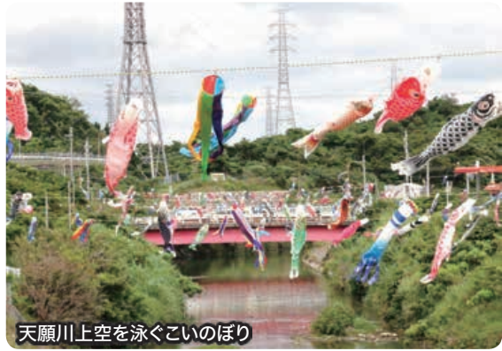
天願川上空を泳ぐこいのぼり