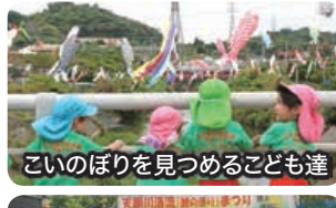
こいのぼりを見つめる子ども達