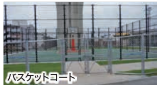
バスケットコート