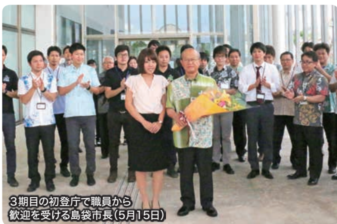
3期目の初登庁で職員から歓迎を受ける島袋市長(5月15日)