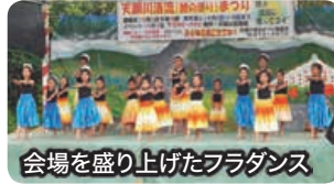
会場を盛り上げたフラダンス

トステージで行われたエイサーの演舞やダンスショーなどの催し物を楽しんでいました。