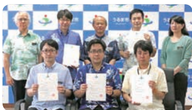
【辞令交付を受けた県税職員】

県税事務所と連携しながら徴収強化に取り組み、市民税及び県民税の徴収率向上に努めます。