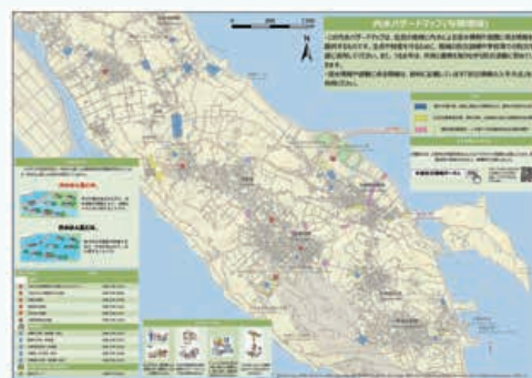
【内水ハザードマップ(※イメージ)】

「うるま市内水ハザードマップ」は、雨天時、過去に浸水の起こった場所や水路の危険箇所(水路のふたが無いなど)、公共施設などを表記しています。マップはうるま市を5つの地域に分けて作成していますので、ご自分の地域をご確認いただき、事前に浸水箇所や浸水時の避難方法などの確認を行ってください。