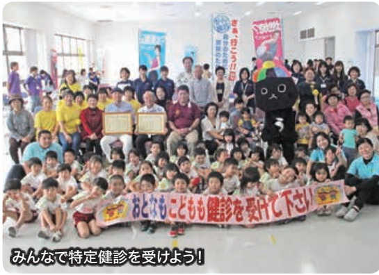
みんなで特定健診を受けよう!