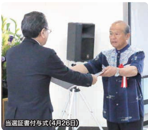
当選証書付与式(4月26日)

その結果として、多くの企業誘致による雇用の拡大等により、完全失業率が大幅に改善され、また、子ども医療費助成制度の対象拡充や、教育基盤の整備など様々な取り組みを行い、子育てしやすい環境づくりに取り組んでまいりました。