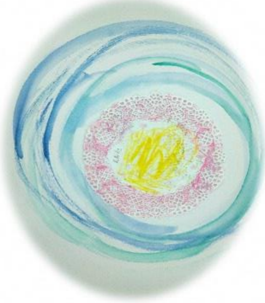
中部療育医療センターより、イラスト提供

医療的ケア児とは、医学の進歩を背景として、NICUに長期入院した後、引き続き人工呼吸器や胃瘻などを使用し、たんの吸引や経管栄養などの医療的ケアが日常的に必要な障がい児のこと。（厚生労働省資料より抜粋）