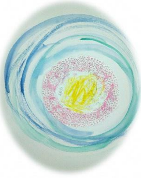
中部療育医療センターより、イラスト提供

医療的ケア児とは、医学の進歩を背景として、NICUに長期入院した後、引き続き人工呼吸器や胃瘻などを使用し、たんの吸引や経管栄養などの医療的ケアが日常的に必要な障がい児のこと。 (厚生労働省資料より抜粋)