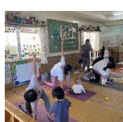
親子ヒーリングヨガ講座