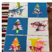
親子アート「糸引きアート」