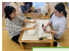
クレイバック講座