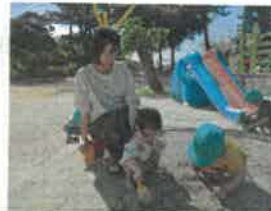
お友達と一緒に楽しい時間過ごしました♪