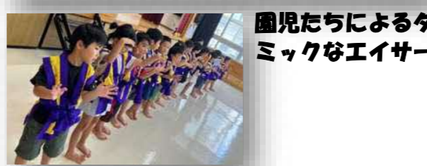
園児たちによるダイナミックなエイサー演舞