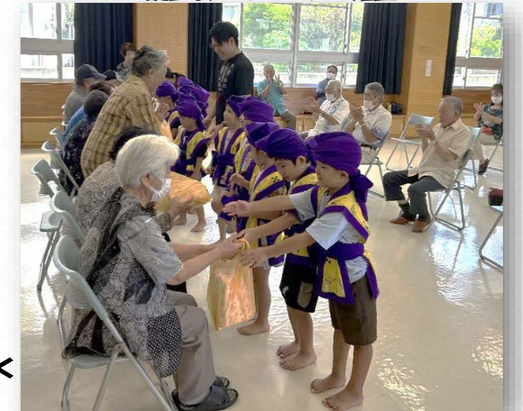
おじいちゃん、おばあちゃんと一緒に楽しく みんなで昼食