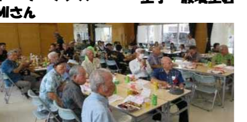
真剣に舞台を見つめる参加者