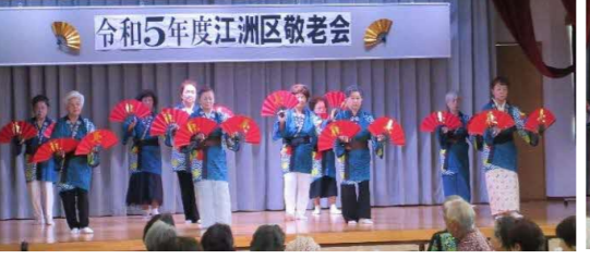
民謡サークルペゴニアの皆さん いーし毛あしび、めでたい節