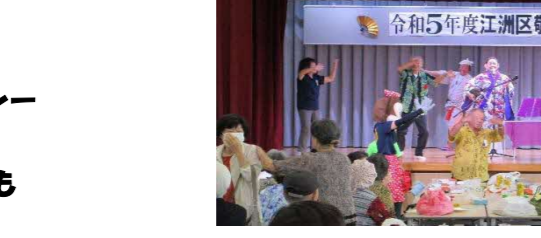
ディズニーからミニちゃんもカチャーシーに参加