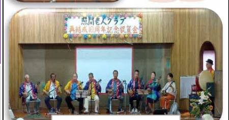
佐渡山民謡同好会