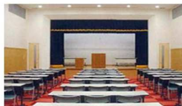
多目的研修ホール(100席収容) 市民活用ができる、ミニコンサートや研修、セミナー、講演会