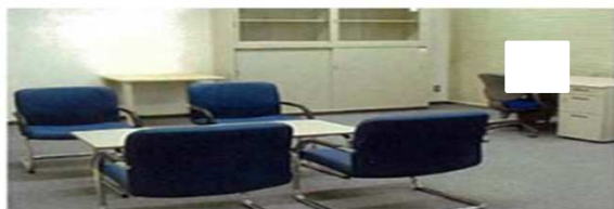
コーディネータールーム(資料室) 地域企業及び起業家のビジネスアドバイザー(現在不在)