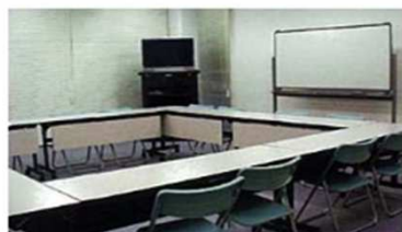
会議室(16名収容) 市民活用ができる、サークル活動やミーティングなど。