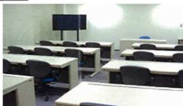
マルチメディアルーム(20名収容) パソコン21台設置 パソコン研修、及び各種講座によりIT技術者を育成