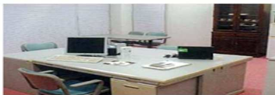
インキュベートルーム 起業家支援、産業の活性化。