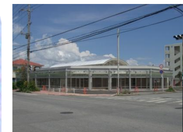
完成した「安慶名店舗」の写真