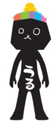
うるま市まちキャラ うるうらら