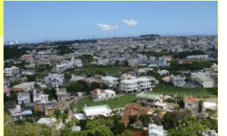
江洲の住宅地(字江洲)