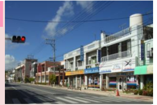
石川の商業地(石川)