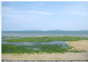
具志川ビーチ(字具志川)