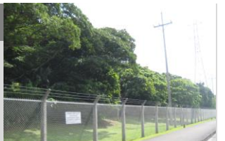
キャンプコートニー(字天願)