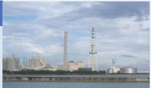
石川火力発電所(石川赤崎)