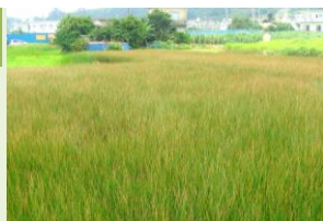
照間のイグサ(ピーグ)畑(与那城照間・字照間)