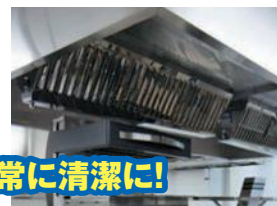
厨房設備は常に清潔に!

清掃、必要な点検及び整備など厨房設備の維持管理は「火災予防条例」で義務づけられています。