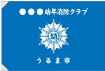
「幼年消防クラブ旗」