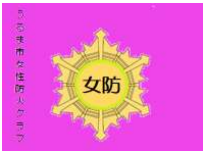
「女性消防クラブ旗」