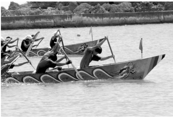
比嘉区の大会では、地元浜中と与勝第二中の中学生が大人顔負けのカイざばきを披露

連日真夏日が続く中、大会には市内外から多くのハーリーチームが参加。今回の各地のハーリー大会は参加チームも増え、例年になくほどの盛り上がりを見せました。