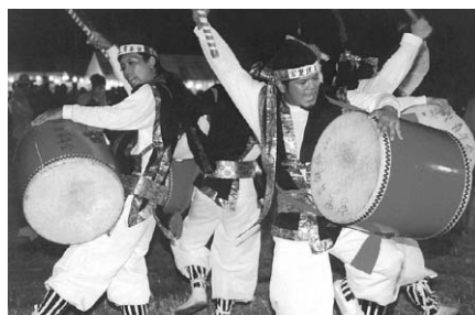
具志川地域のエイサー(宮里)

曜日：8月17日(水)～19日(金) 場所：集落内(午後7時～) 問い合わせ先：宮里公民館 TEL098-973-9013