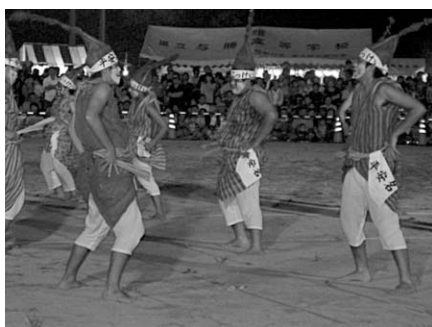
勝連地域のこっけい踊り（平安名）