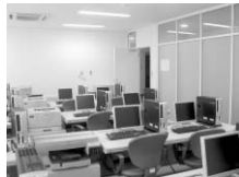
■マルチメディアセンター