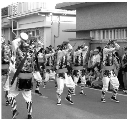
与那城地域のエイサー（屋慶名）