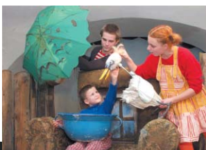
「みくろアヒルの子」