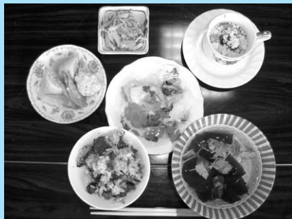
平成16年度メニュー