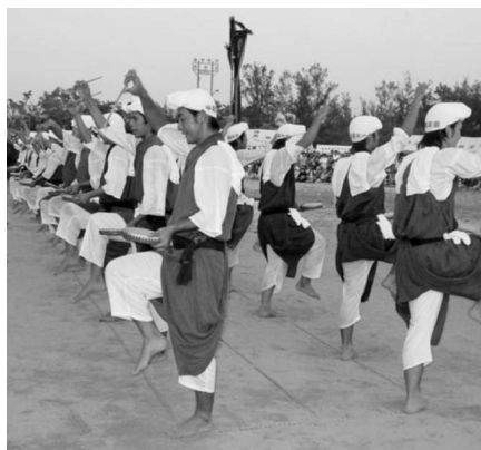
勝連地域のエイサー（平敷屋）