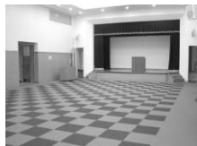
■多目的研修ホール