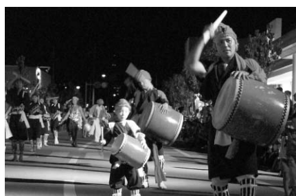
石川地域のエイサー(城北)

曜日：8月16日(火)～18日(木) 場所：集落内(午後6時～) 問い合わせ先：曙公民館 TEL098-965-4780