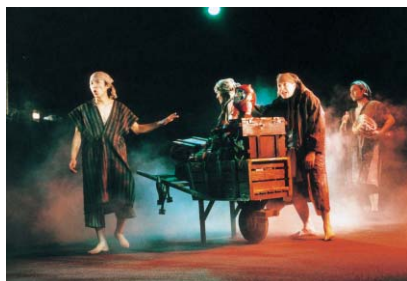
「だるまさんがころんだ」