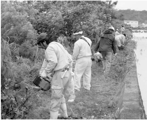
護岸の清掃作業を行なう市建設業者会の皆さん

この活動は日ごろ、道路建設や土木工事などで地域の方々に世話になっているとして、そのお返しとして毎月第四土曜日を地域への奉仕活動の日と定め、市民が利用する公園などの清掃活動などを実施しています。同会は「今後も地域のためになるよう継続していきたい」としています。