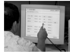
画面上で簡単に求職情報が検索できる