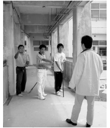
真剣な表情で訓練に取り組む男性教諭

訓練では、不審者が刃物を持って授業中の教室へ侵入したという想定で、児童の安全確保や警察署への連絡体制、先生方の警官到着までの不審者への対処などが的確に行えるかを確認しました。参加した一人の男性教諭は「訓練でも怖い気がした。実際に起きたら不安はある」と感想を述べていました。終了後、体育館ではうるま警察署員が全児童に「不審者が声を掛けたら、勇気を出して断る。危険を感じたらすぐに太陽の家等に逃げ込み、警察へ通報する」ことなど実際にあつた事件を舞台で演じ、注意を呼びかけました。