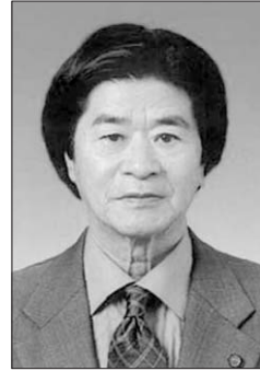
執筆：名嘉山兼宏氏 元具志川市教育長