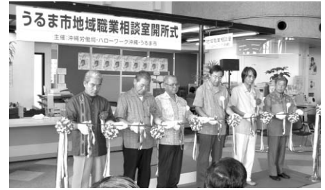
7月15日に行われた開所式の様子