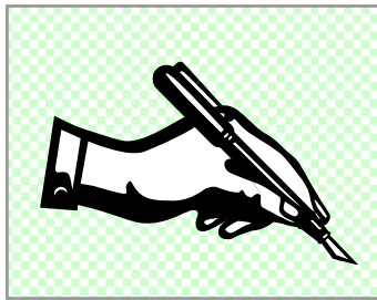
文通武者修行中の主人公。