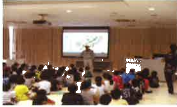
▲石川浄水場にて(田場小)

【施設見学会実施小学校】 宮森小 *城前小 *伊波小 *川崎小 *天願小 *田場小 *具志川小 *あげな小 計8校