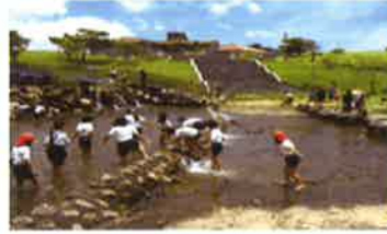
▲倉敷ダムにて(あげな小)