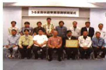
▲うるま市管工事組合