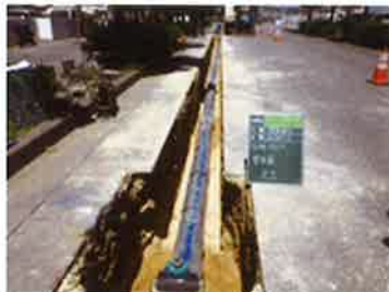
配水管工事の布設

また、石川一丁目・白浜一丁目・東恩納地内にて各家庭に引き込む給水管の切替工事の計画及び工事を行っています。