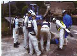
▲福岡市水道局職員と協力しての復旧作業状況