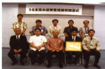
▲フジ地中情報株式会社

平成25年度に策定したうるま市水道事業有効率改善計画では、平成26年度から3年間で無効水量60万m 3 を削減し、有収率を3%以上改善する目標を掲げ、漏水調査の専門である『フジ地中情報株式会社』からの漏水調査や漏水対策の指導・助言を受け、老朽給水管の更新並びに修繕工事を『うるま市管工事組合』に担っていただき取り組んで参りましたが、平成27年度末の実績において無効水量約66万m 3 削減、有収率4.37%の改善が図られ、改善計画2年目にして目標を達成する運びとなりました。よって、本市水道事業に対する両事業所の多大なる貢献に対して、うるま市長より感謝状を贈呈しました。