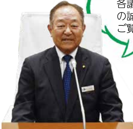
議長 比嘉 直人

『一般質問』は、議員が市の行政全般にわたり、執行機関に対し事務の執行状況及び将来に対する方針等について所信をただし、あるいは報告、質問を求め、又は疑問をただすことをいいます。