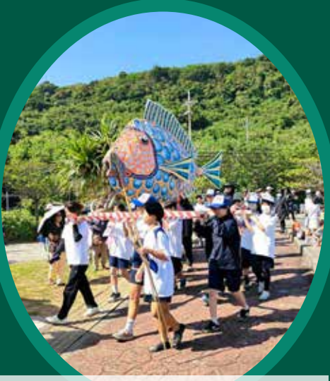
平安座サングワチャーにて島内を練り歩く

うるま市議会では広報に関するアンケートを実施しています。QRコードからご回答いただけます。貴重なお意見をお聞かせください。