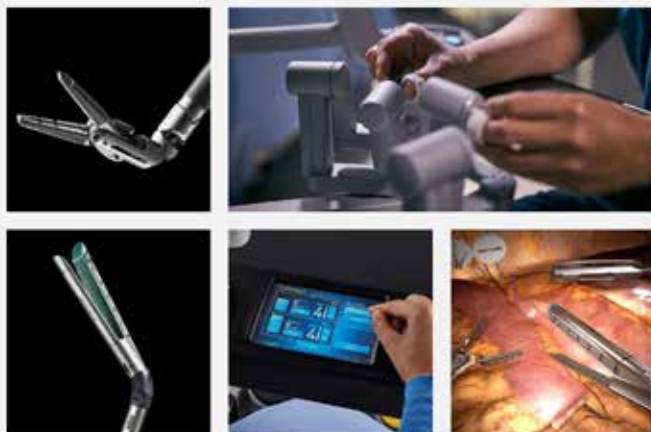
▲導入された手術支援ロボット「da Vinci XI」。 細かい作業が可能で、通常の手術に比べ出血や痛みが少なく、難しい手術に対応可能。特に前立腺がんにおいて周辺組織への影響が少なく、後遺症の軽減が実現されている。