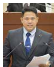
【提出者】 天願こうや議員

衆議院議長、参議院議長、内閣総理大臣、内閣官房長官、総務大臣、法務大臣、男女共同参画担当大臣