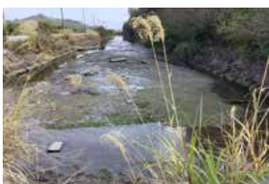
南風原地区遊水池