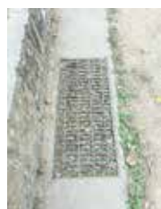
運動場の排水側溝

A (鹿川学校教育部長) 運動場の排水側溝について、清掃業務の委託により軽微な清掃は対応可能。