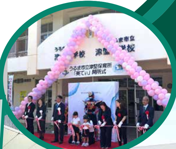
うるま市立津堅保育所開所式のテープカット