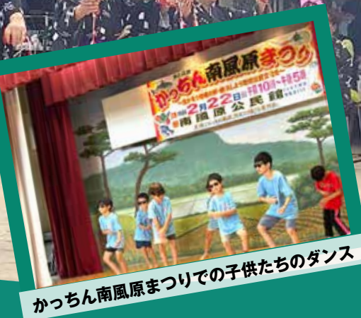
かっちゃん南風原まつりでの子供たちのダンス