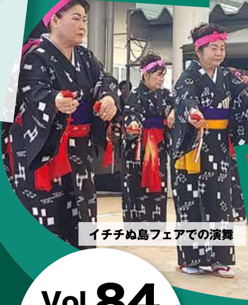
イチチぬ島フェアでの演舞