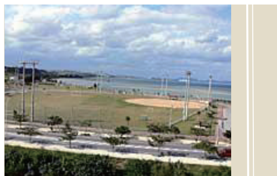
うるま市与那城総合公園多種目球技場