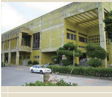
うるま市石川体育館