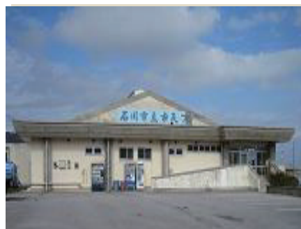
うるま市石川プール