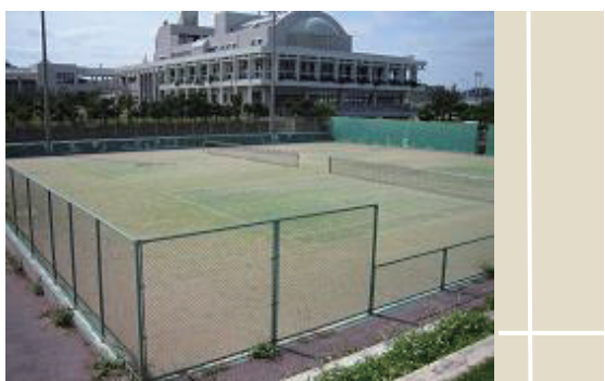
うるま市与那城総合公園庭球場