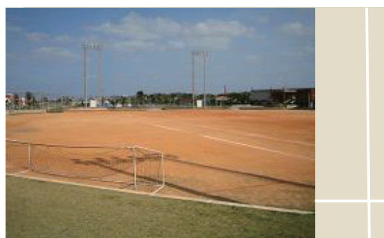
うるま市与那城総合公園多目的広場