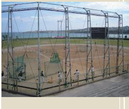
エナジックスタジアム石川 (うるま市石川野球場)