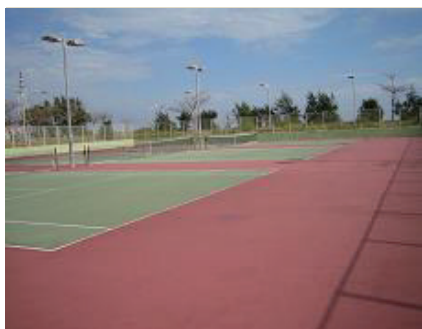
うるま市石川庭球場