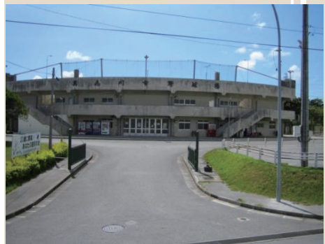
うるま市具志川庭球場