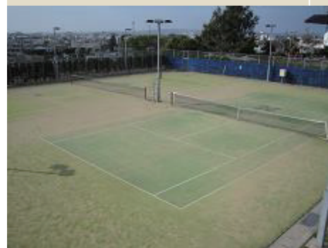
うるま市喜屋武マープ公園庭球場