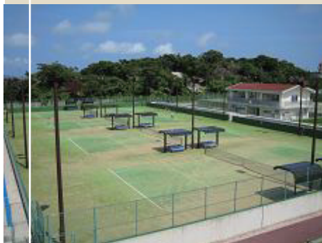
うるま市具志川野球場