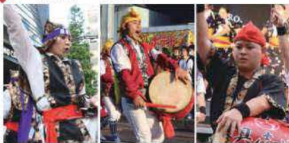
屋慶南青年会(新宿)、赤野青年会(宇都宮)、具志川青年会(盛岡)と、3つの青年会が県外でのイベントで伝統的なエイサーの踊りをPRしました。