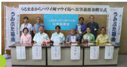
10月6日、ハワイ州マウイ島で発生した山火事の復興を支援するため、沖縄ハワイ協会へ2,000万円の義援金を贈呈しました。