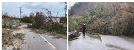
8月初旬、沖縄本島を2度暴風域に巻き込んだ台風6号による影響で、長時間に及ぶ大規模な停電、断水、情報通信設備の遮断、道路損壊・土砂崩れ等の大きな被害が確認されました。