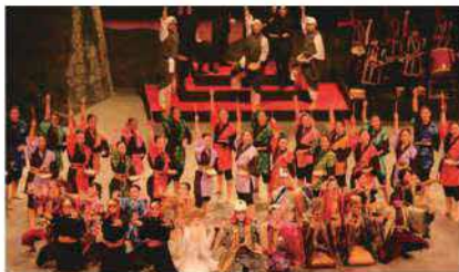
8月20日～21日、現代版組踊「肝高の阿麻和利」は東京都文京区シビックホールにて全4公演を披露し、約4,300名余の観客を魅了し、会場全体が感動の渦に包まれました。