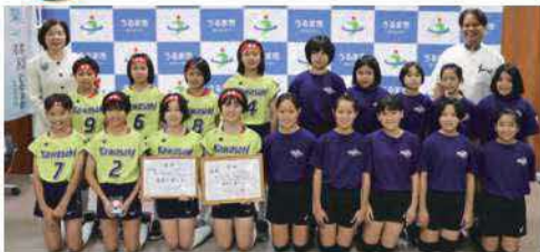
10月1日(日)に開催された、「DreamCap2023」において、うるま市から川崎クラブが優勝、平敷屋クラブが準優勝の成績を納め、市長、教育長へ報告に訪れました。この大会で2チームは1月に開催される「第11回熊本・沖縄交流の翼小学生新人バレーボール大会」への出場権を獲得し、県外派遣への意気込みを伝えました。