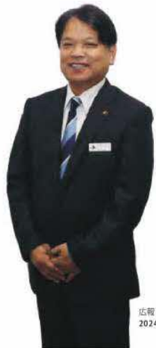
うるま市長 中村 正人

こうした社会情勢の影響による原材料費、燃料費の高騰に伴う生活用品の値上がりにより、私たちの生活は厳しい状況に置かれております。国においては、減税や給付金など新たな経済対策を打ち出しており、これらの迅速な