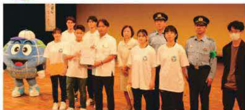
うるま市では、～薬物にNO!と言える勇気を～をスローガンに、大麻などの違法薬物が社会に蔓延し、青少年を害することを許さない、うるま市総決起大会を石川会館大ホールにて開催しました。