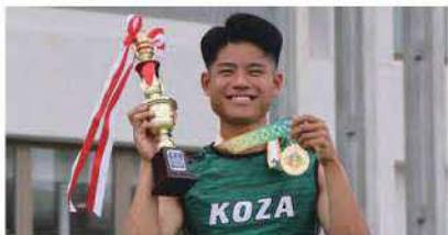
8月2日、北海道で開催された、全国高校総体男子400M決勝において、自身の県高校記録を0.42秒更新する46秒63で沖縄県勢初の優勝を果たし、金メダルを勝ち取りました!