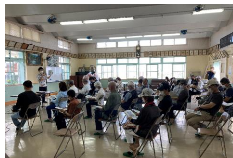
令和3年10月31日 喜仲公民館

回答：他地区では役員報酬を支払っているところもあります。その報酬等のルールは今後検討を行います。