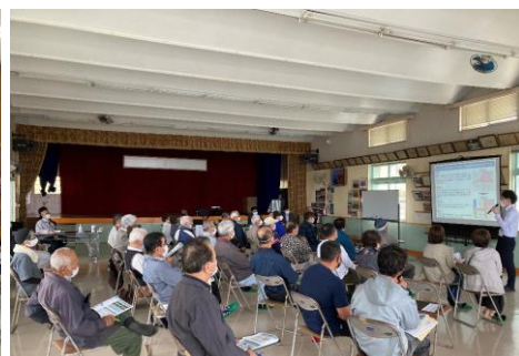
令和3年11月28日 喜仲公民館