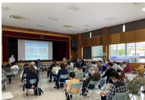
令和3年11月14日 上江洲公民館