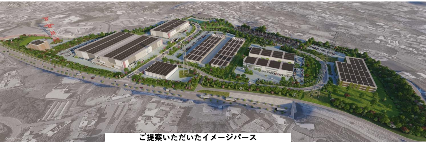
ご提案いただいたイメージパース