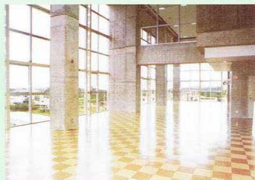
ラウンジ(手前) リハーサル室(奥)