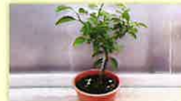
カンキツ類の苗木

詳しくは、事前に裏面★印の植物防疫所にお問い合わせください。なお、現在小笠原諸島には蒸熱処理施設がありません。