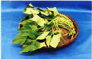
サツマイモ(紅イモなど) の生茎葉