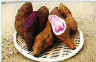
サツマイモ(紅イモなど) の生塊根