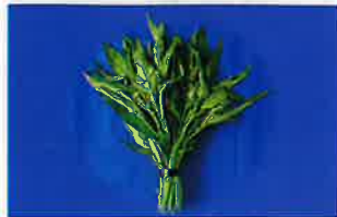
エンサイ(空心菜・ウンチェーバー) の生茎葉