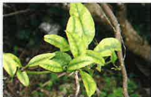
カンキツグリーニング病菌 (病気の症状)